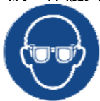
密閉度の高いゴーグル