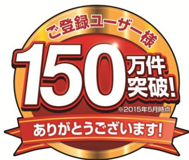
登録ユーザー150万件突破記念感謝ロゴ

第1弾では、2015年5月に登録ユーザー数が150万件を突破したことを受け、当社のオリジナルマスコットキャラクター「モノタロウ侍(ざむらい)」のイラストが施された、完全生産限定のモノタロウ特製オリジナルうちわ、“アオイダロウ FAN! FUN! モノタロウうちわ”を先着5,000名のユーザーに¥0円で販売開始いたします。