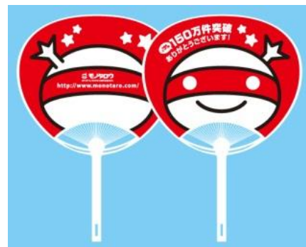
アオイダロウ FAN! FUN! モノタロウうちわ

当社では、本キャンペーンを通して、創業以来多くのユーザーの皆様にご愛顧いただいた感謝をお伝えすると同時に、これからもより長く、そしてより多くの方にご利用いただけるよう、あらゆる現場の多様なニーズに応え、ユーザー利便性の向上を目指します。そのためにも、今後もワンストップショッピングの充実と効率的な購買プラットフォームを構築し間接資材購買の効率化に貢献してまいります。